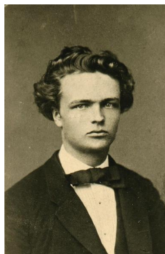
Portrait du Diable au Codex Gigas – Portrait du jeune August Strindberg