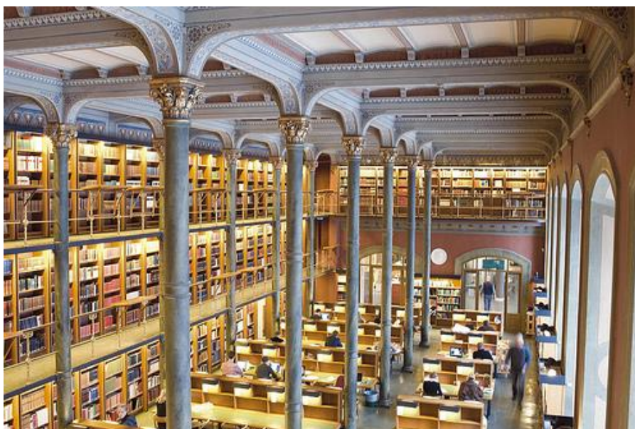
Salle de lecture principale